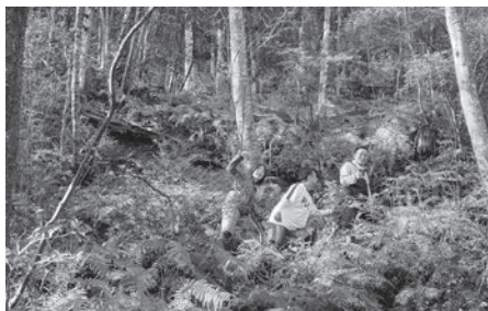
②会社のメンバーで村の山に登ることも。