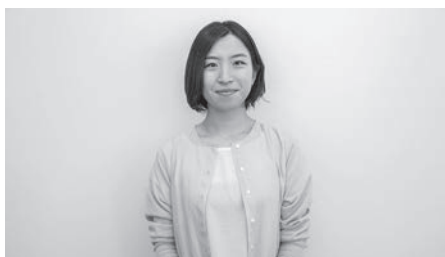
③村で実施している宿泊型転地療養サービス「ムラカラ」のセンター長を務める。