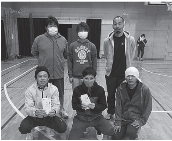
プレーオフ優勝チーム「DAISUKE」