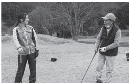
①池の平ゴルフ場でゴルフの練習。

「下北山村の方々とはにかく元気だと感じています。お年寄りの方々も畑で野菜を作っているし、とにかく